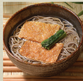
きつねそばうどん KITSUNE SOBA/UDON Mì đậu phụ tươi kiểu Nhật 98 000 (VND)