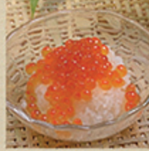
いくらおろし IKURA OROSHI Trứng cá hồi 98 000 (VND)