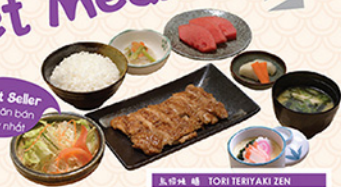
鳥焼 雫 TORI TERIYAKI ZEN

Kabochi, chicken teriyaki served with steamed rice, Japanese egg custard, miso soup, pickles and dessert