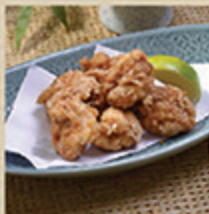
イカゲソカラアゲ TOBI KARAAGE Cá nêi xương chiên giòn 78 000 (VND)