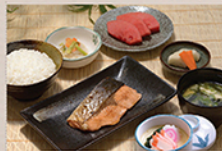
鮭焼肉 SALMON TERIYAKI Cá ngừ sốt tương