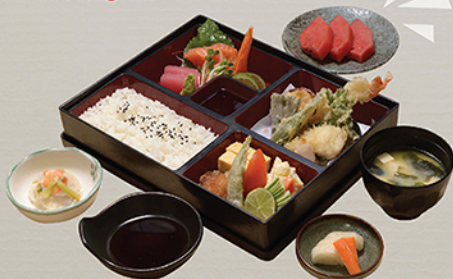
ミックス MIXED BENTO

Phở cơm hộp nhiều món khác nhau, sashimi cỡ nhỏ & 100g 168 000 (VND)