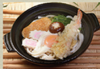
鍋焼きうどん NABEYAKI Mì nấu với kiểu Nhật 108 000 (VND)