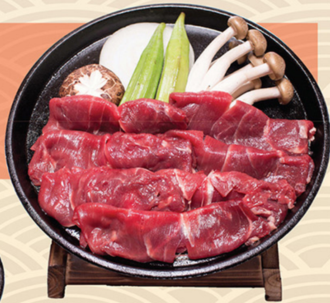
Gyu Touban Yaki 牛 唐板焼き 128.000 vnd