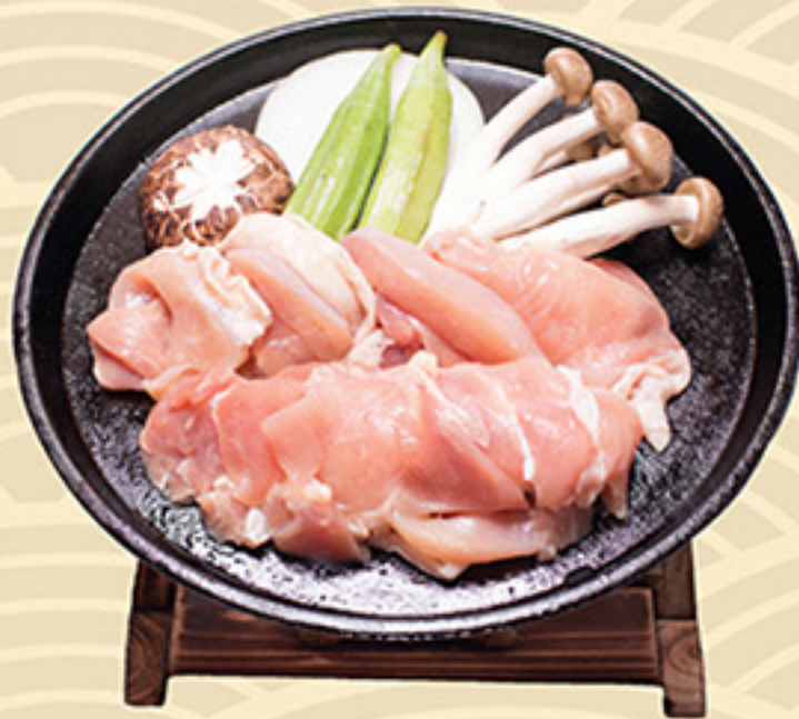
Tori Touban Yaki 鳥 唐板焼き 78.000 vnd