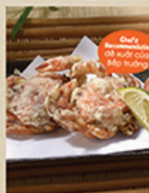
ソフトシェルクラブ天ぷら SOFT SHELL CRAB TENPURA Cua lột tôm bột tempura chiên giòn 72 000 (VND)