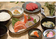
お魚と天婦羅セット SASHIMI & TEMPURA ZEN

Kabochi, cơm các món sashimi và tôm bột tempura, món trứng sữa kiểu nhật, súp miso, dưa chua và món tráng miệng