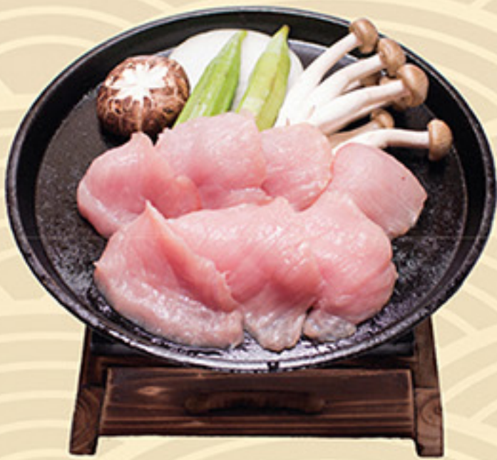
Buta Touban Yaki 豚 唐板焼き 78.000