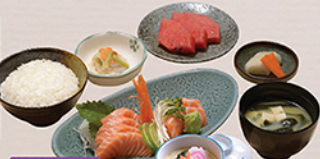
鮭刺身セット SALMON SASHIMI SET Phở sashimi cỡ nhỏ 138 000 (VND)