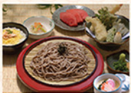
天ざる・うどんセット TEN ZARU & MINI DON

Các món làm từ tempura, mì kiểu machi, và cơm cỡ nhỏ