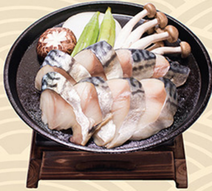
Saba Touban yaki 鯖 唐板焼き 78.000 vnd