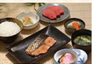
鮭焼魚セット SALMON TERIYAKI