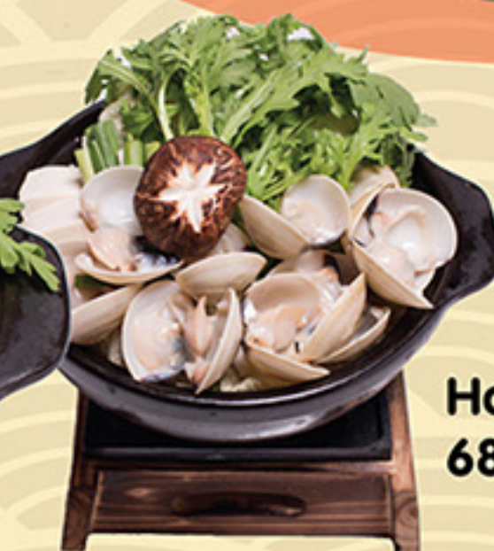
Hamaguri Nabe 68.000