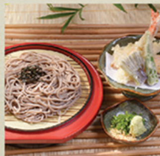
天ざるそばうどん TEN ZARU SOBA/UDON Mì kèm các món tôm bột tempura kiểu Nhật 78 000 (VND)