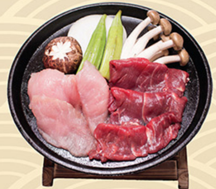
Mix Touban Yaki ミックス 唐板焼き 118.000