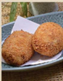
コロッケ KORROKE Khoai tây nghiền chiên giòn 46 000 (VND)

Món ăn được chiên ngập dầu đến khi ngả màu nâu vàng và phủ một lớp bột vàng giòn chắc chắn sẽ làm thỏa mãn những thực khách yêu thích các món chiên giòn.