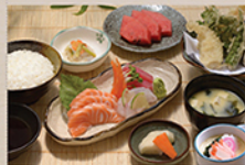
刺身と天ぷら SASHIMI & TEMPURA ZEN Kabocha, cơm trộn, mì sashimi và tôm bột tempura, món tương sashimi, súp miso, dưa chuột và món tương mỳ