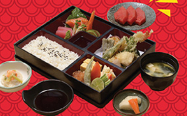
お弁当 雑貨 MIXED BENTO