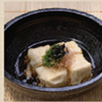
天ぷら AGEDASHI TOFU Đậu phụ chiên giòn 58 000 (VND)