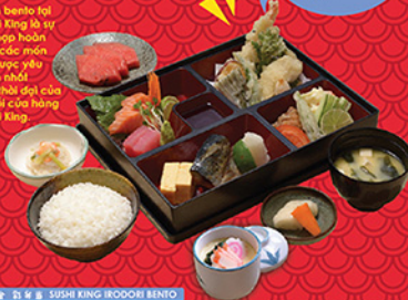
お弁当 推薦 SUSHI KING'S BENTO

Our bento for Sushi King là sự kết hợp hoàn hảo của món ăn được yêu thích nhất mọi thời đại của chuỗi cửa hàng Sushi King.