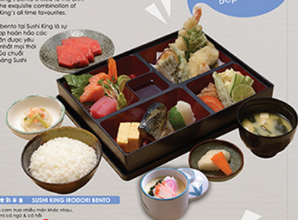
イロどり SUSHI KING IRODORI BENTO

Chef's Recommendation đề xuất của Bếp trưởng