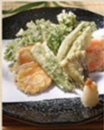
天ぷら YASAI TENPURA Các loại rau tôm bột tempura 52 000 (VND)