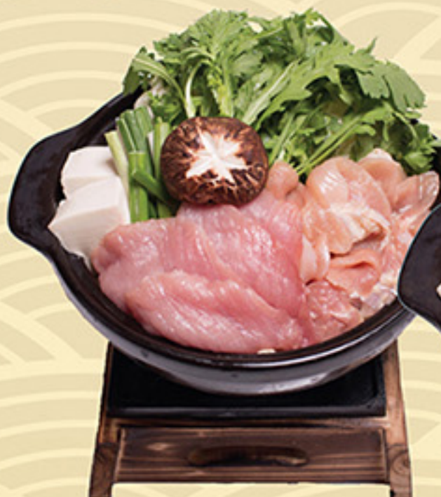
Tori & Buta Miso Nabe 88.000