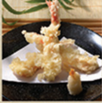
天ぷら EBI TENPURA Tôm tôm bột tempura chiên giòn 88 000 (VND)