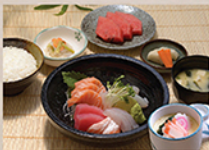
刺身セット SASHIMI SET Phở sashimi cỡ nhỏ