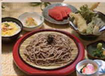
天ざる & ミニ丼 TEN ZARU & MINI DON Các món sashimi teriyaki, mì zaru, mỳ udon và cơm cỡ nhỏ