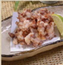
イカゲソカラアゲ IKA GESO KARA AGE Cá mực chiên giòn 58 000 (VND)