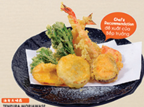
天ぷら TENPURA MORIYASE Các kiểu tôm bột tempura 88 000 (VND)