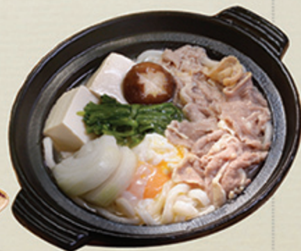
すき焼きうどん SUKIYAKI UDON Mì nước súp sukiyaki kiểu Nhật 148 000 (VND)