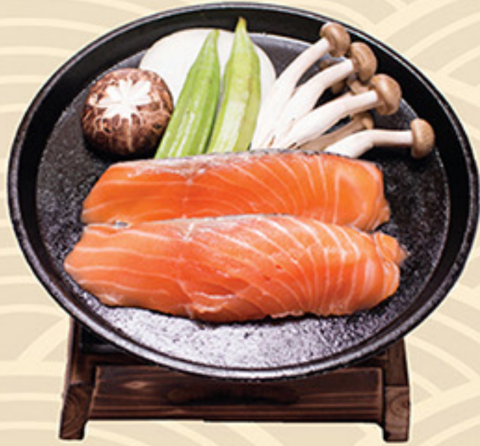
Salmon Touban yaki 鮭 唐板焼き 118.000 vnd