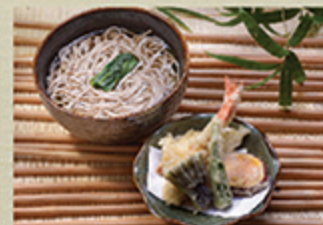
天ぷらそばうどん TENPURA SOBA/UDON Mì tôm bột tempura kiểu Nhật 118 000 (VND)