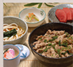
焼肉丼とミニうどん YAKINIKU DON & MINI UDON Cơm trộn bò BBQ, sashimi và mì udon cỡ nhỏ 128 000 (VND)