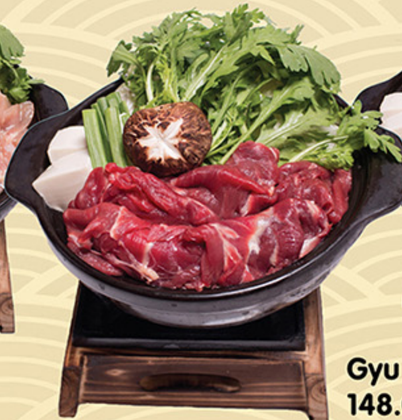
Gyu Nabe 148.000